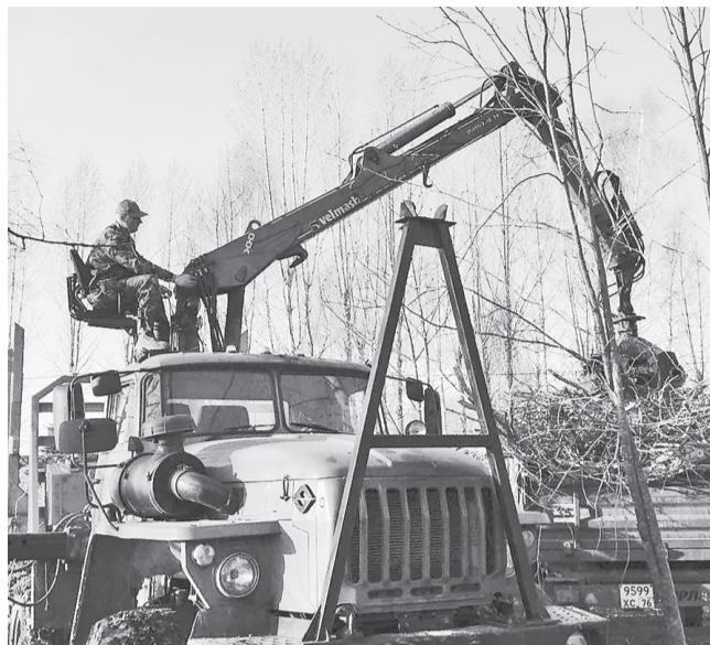
В селе Спас-Виталий спилили старые тополя

– Для Красного Бора мы запустили аукцион на выполнение работ по сооружению наружных сетей бытовой канализации. Строительство системы водоотведения начнем