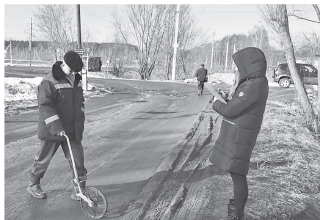
Подготовка к ремонту дорожного полотна