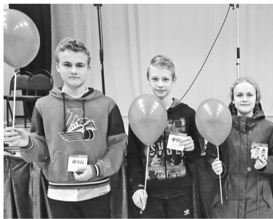
Члены ВО «Медведи»