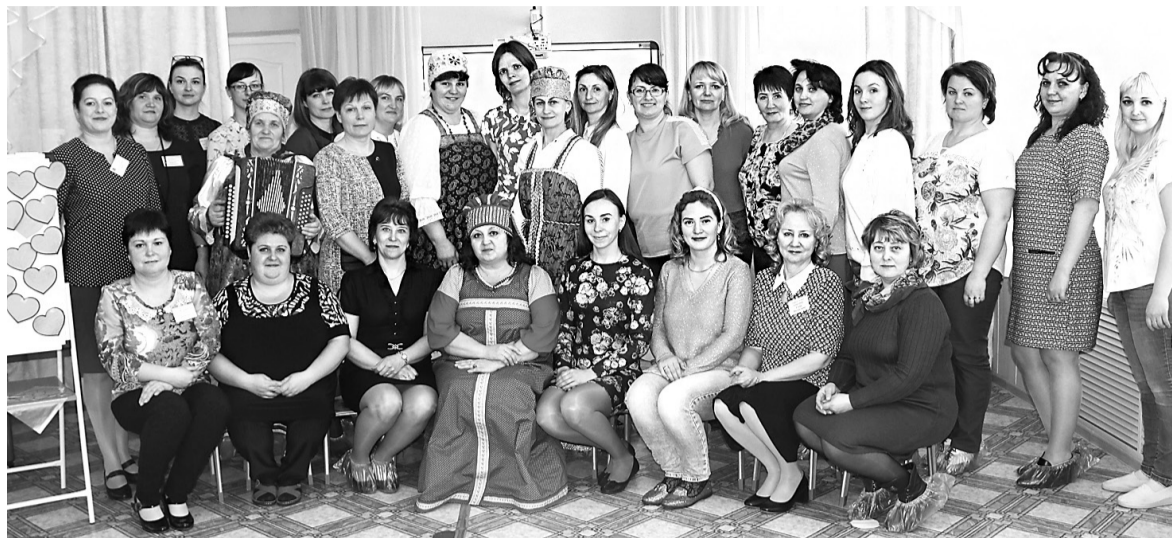
Участники межмуниципального семинара в детском саду «Ягодка»

Педагоги тутаевского детского сада «Колокольчик» провели мастер-классы «Формирование толерантного отношения к детям с ограниченными возмож-