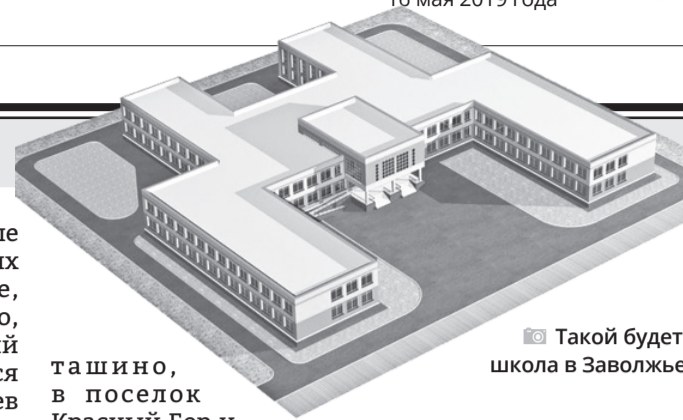
Такой будет школа в Заволжье

– Жителей интересует ремонт дорог. Одно из обращений на приеме